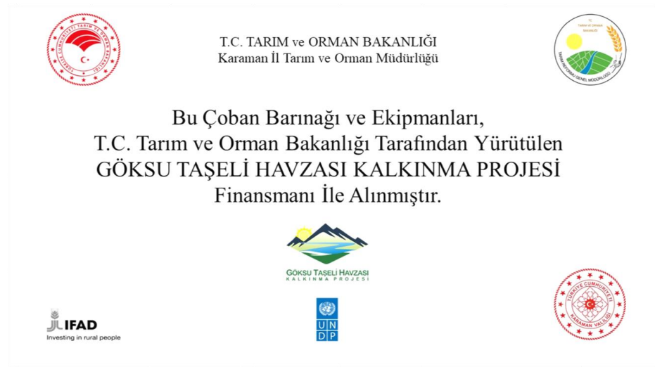
Tabela aşağıdaki gibi olacaktır.

Ödemeler, İl/İlçe Müdürlüklerinin tüm dosya içeriğini İPYB'ye göndermesinin ardından, dosya üzerindeki incelemeler tamamlandıktan sonra EPDB/MPYB'nin onayı ile UNDP tarafından yararlanıcının hesabına gönderilmek suretiyle yapılır.